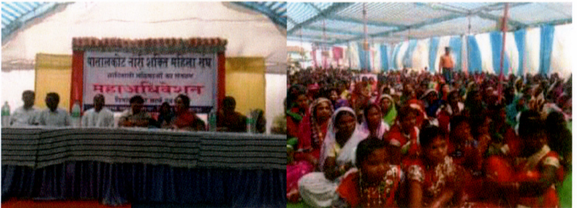
(पातालकोट नारी शक्ति महिला संघ महाधिवेशन छायाचित्र)